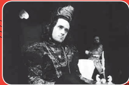
plešatá zpěvačka, 1995