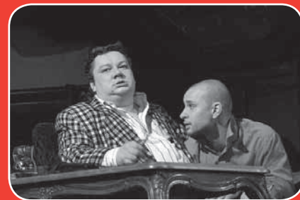
chaos je sousedem boha, 2004

„Tobě se to takhle líbí? Jo? Tak to je ohromný, to to máme hotový.“ Když spolupracovníci pana režiséra Janíka slyšeli tohle, věděli, že je k cíli ještě hodně daleko. Pan režisér neustále kladl otázky. Od počátečních schůzek po generálky. Ptal se po jednoduchých, základních