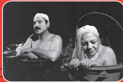
konec hry, 1997