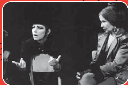
tři velké ženy, 1996