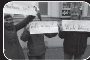
loučení s výletníky