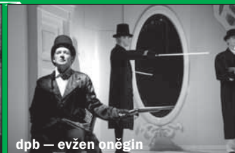
dpb — evžen oněgin