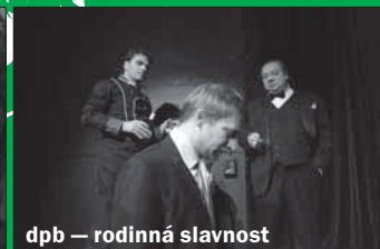
dpb — rodinná slavnost