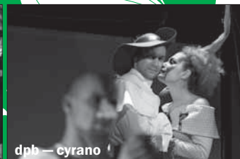
dpb — cyrano