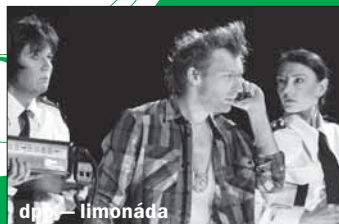
dpb — limonáda