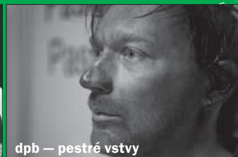
dpb — pestré vrstvy