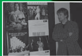
režisér zdeněk dušek